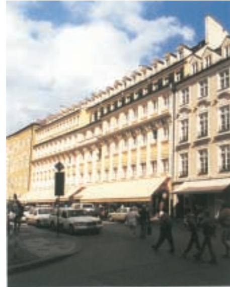
Alter Hof, München