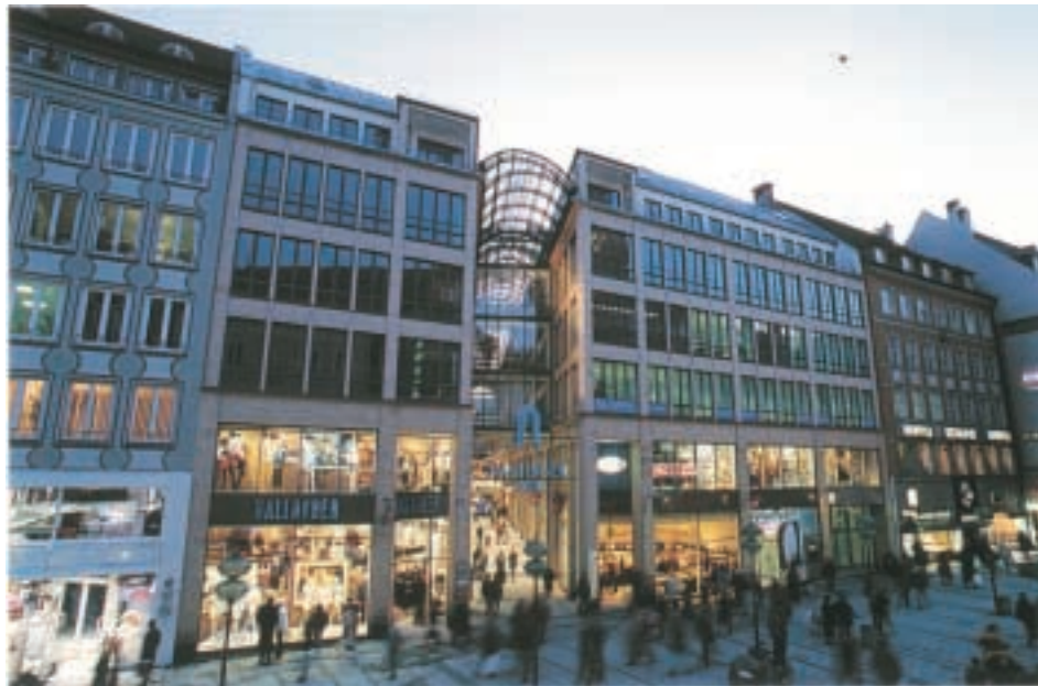
Kaufinger Tor, München