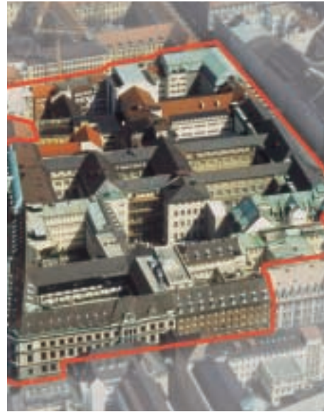
Fünf Höfe, München