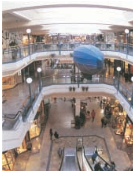
Uni-Center, Buenos Aires