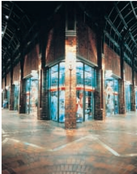
Hanse-Viertel, Hamburg - Allianz