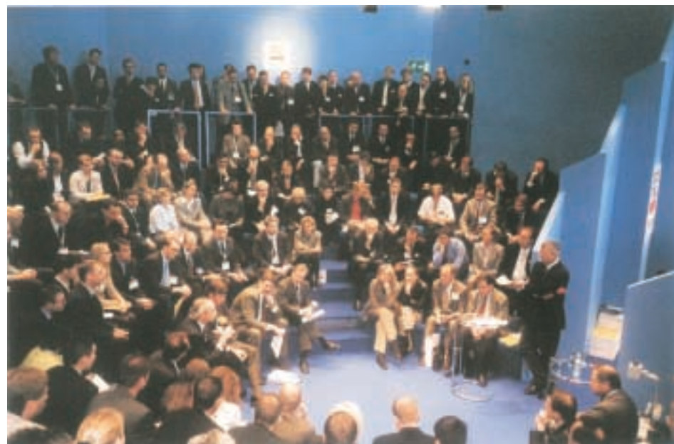
EXPO REAL-Forum, München

Experten aus dem In- und Ausland, insbesondere aus der Immobilienwirtschaft, nehmen an diesen Tagungen teil. Die Moderation der EXPO REAL-Foren sowie die fachliche Beratung des Dokumentarfilms „Die Schöpfer der Einkaufswelten“ sind weitere Beiträge zur Intensivierung der Kommunikation.