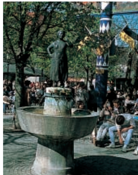
Viktualienmarkt, München - DBVI