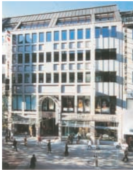
Königstraße, Stuttgart - IBM