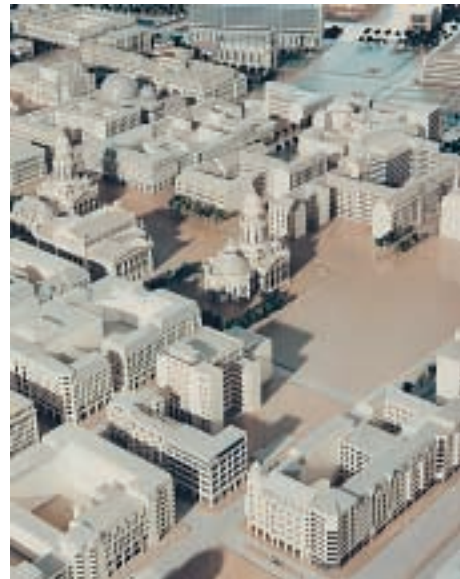
Friedrichstadt Passagen, Berlin