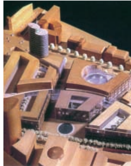
Galeria Ventuno, Stuttgart