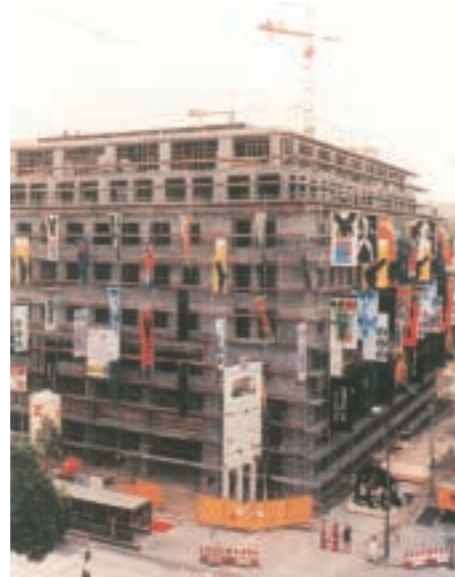
Lindencorso, Berlin, VW-Konzern