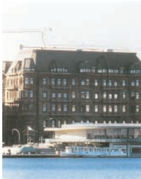
Hamburger Hof, Hamburg - MEAG